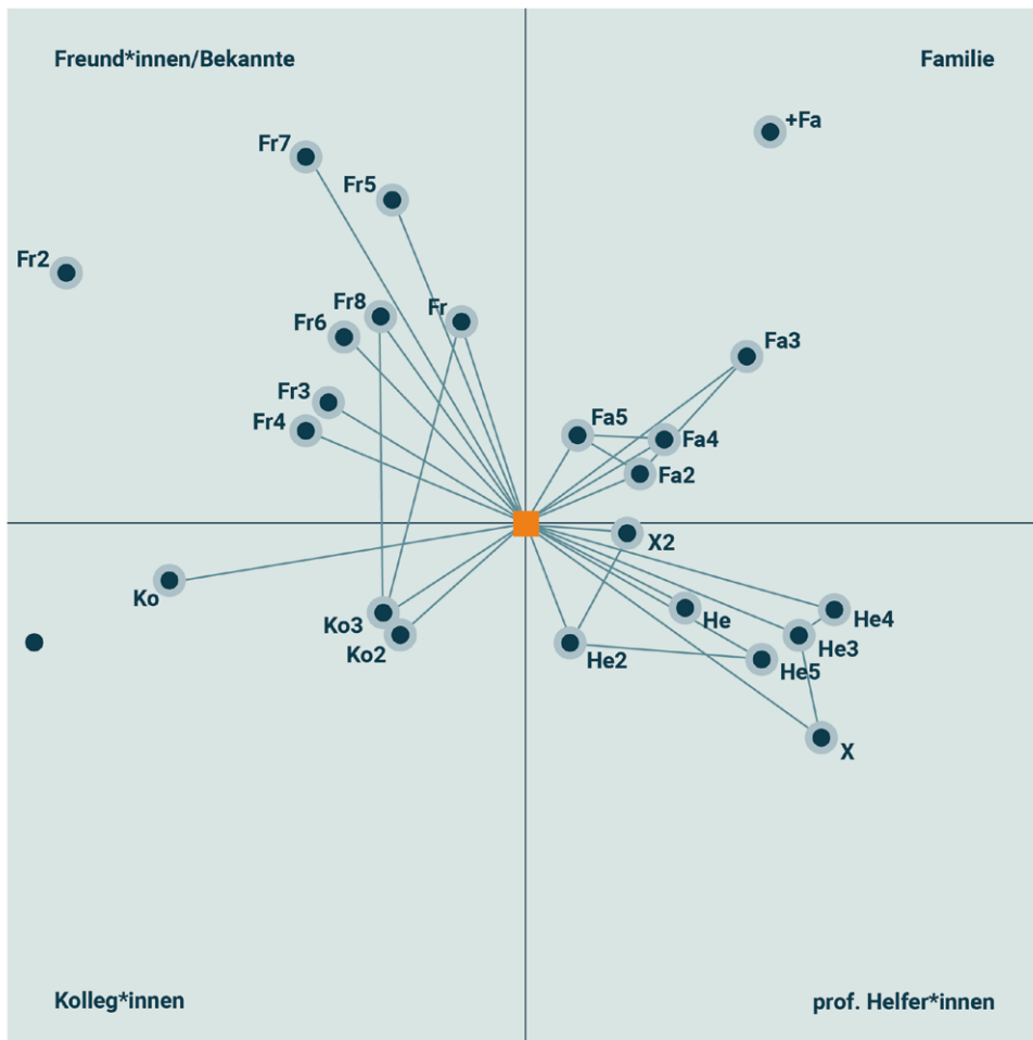
Abb. 2: Beispiel einer anonymisierten egozentrierten Netzwerkkarte.